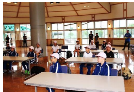
①6:50分集合で、まずは出発式