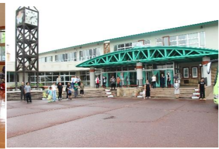
②早朝の見送り、ありがとうございました。