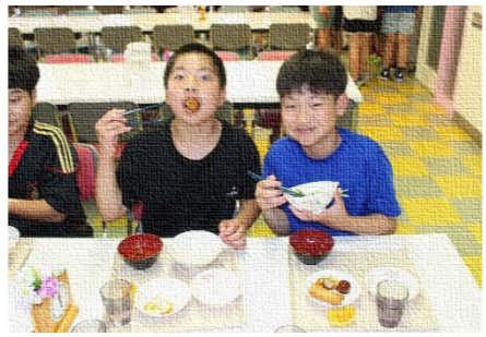
⑦やっぱりおいしい!みんなで食べるごはん。